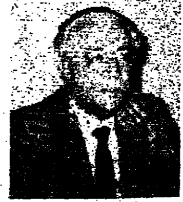
المدعي شقيق منهنسة

كتب خالد اللحام: ذكريات بيروتية... اطلالة جديدة مع بيروت الحالم الذي تنتمي في عيون حافية كما كان. اطلالة على ذاكرة رجل كان لهم تاريخها ورجلها وعشورا في خضم مساهمتها وصراعتها. وقدموا لقبهم متحدثين ما أمكن عن بعض ما عرفوه وعن نسبا.